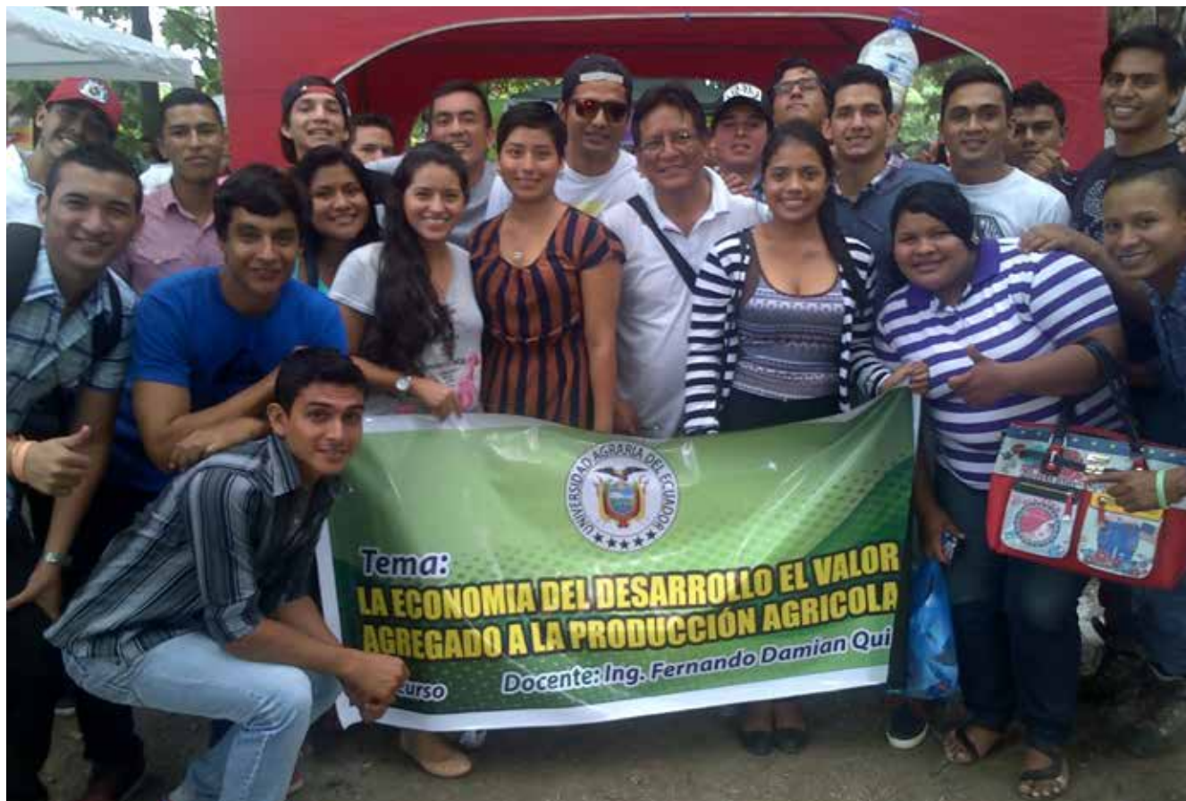
La Agraria forma Misioneros de la Técnica en El Agro.

Resulta fundamental entonces conocer los principales factores que influyen en la economía del país, a fin de prever escenarios futuros para actuar acorde con las circunstancias, en lugar de reaccionar a las mismas que a veces es demasiado tarde, entonces, adelantarse a futuros acontecimientos con una adecuada lectura de los indicadores económicos permitirá al gerente de la empresa agropecuaria, aplicar la estrategia necesaria. Pues calcular el momento adecuado lo es todo: en el amor, en la guerra y sobre todo, en la gestión del ciclo económico.