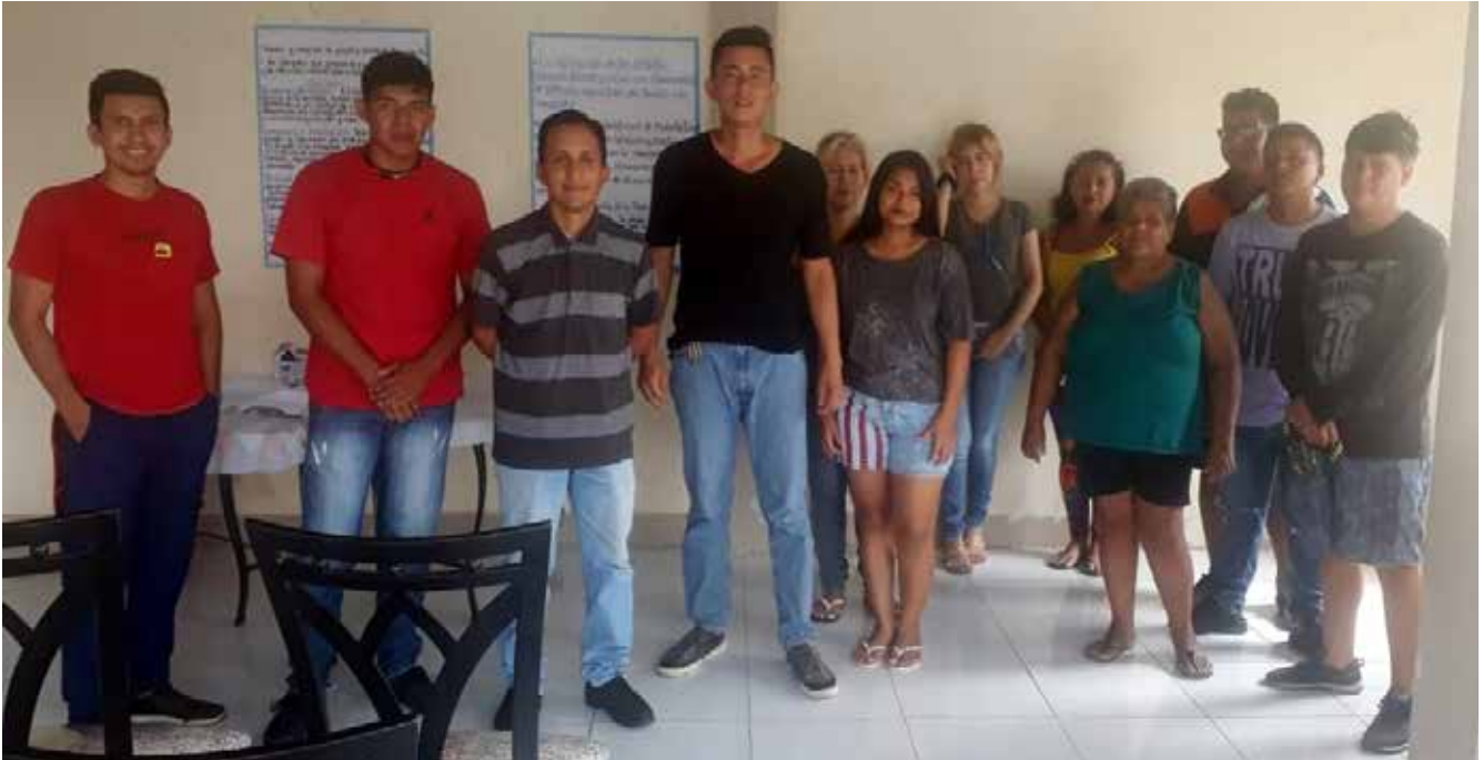
Los beneficiarios de proyecto, al inicio de las charlas.

de la empresa y factores que se deben tomar en cuenta. A través de este plan de negocios se ha logrado determinar el mercado al que estará enfocado, que será la clase media - media alta, y esto se ha logrado determinar por el análisis de mercado realizado en la parroquia Roberto Astudillo. También se logró diagnosticar las características que debe tener el café para que éste sea del agrado del cliente, como son: el aroma, sabor y consistencia.