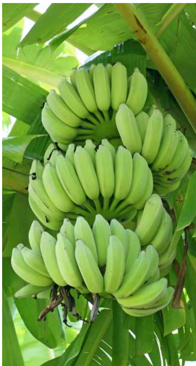
Ecuador nutre al mundo con su banano de primera calidad.

A pesar de estas virtudes de gestionar mejor el ciclo económico, hay un problema, es muy difícil determinar los movimientos futuros en ese ciclo, precisamente aquí es donde una comprensión más amplia y profunda de la macroeconomía, puede resultar muy útil para la planificación en el sistema de producción agropecuario.