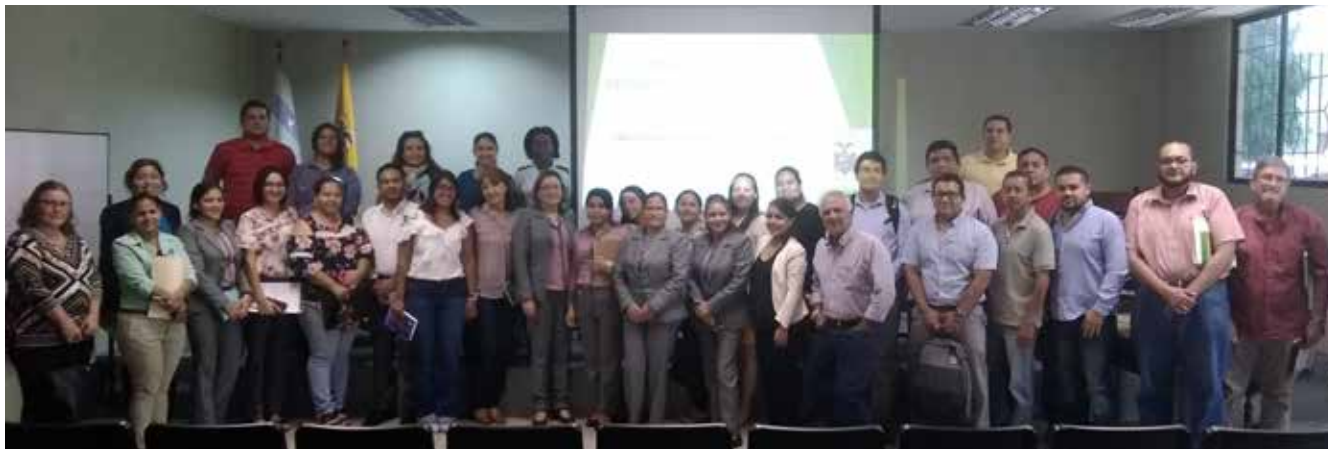
Docentes y personal administrativo se reúnen para conocer el PEDI2019-2023.