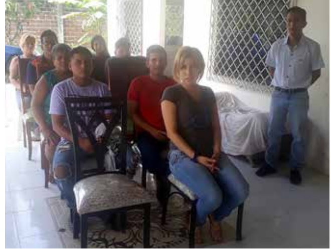
Los moradores se mostraron muy atentos y contentos a la hora de las charlas.